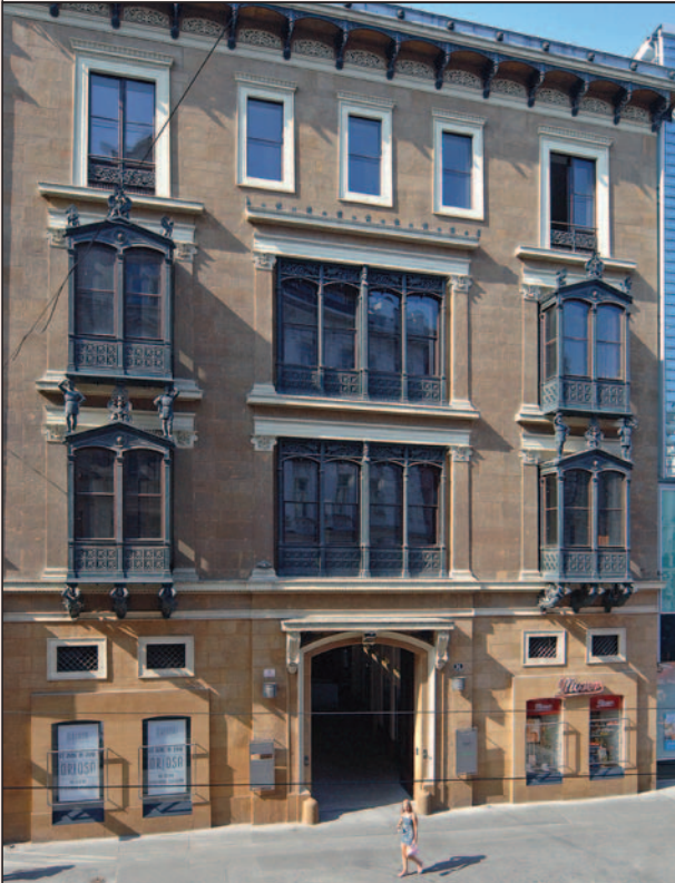
Budova pobočky ČAK v Brně – Kleinův palác