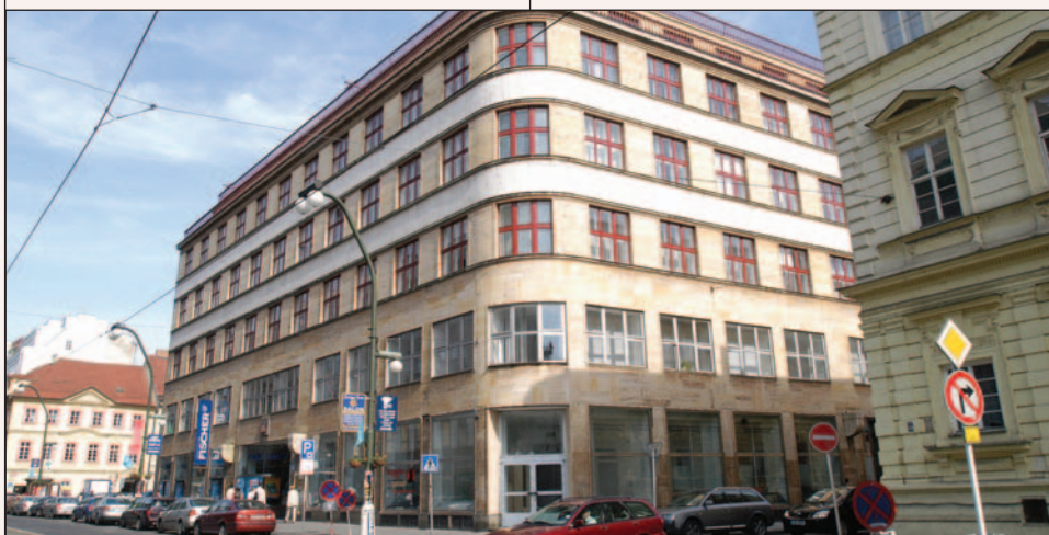
Budova Školického centra ČAK – palác Dunaj

Představenstvo dále klade důraz na průběžný monitoring jak advokátních témat (volný pohyb advokátů, deontologie, pojištění advokátů), tak témat týkajících se výkonu advokacie v jiných zemích EU (pravidla, tarifní předpisy). Odboru mezinárodních vztahů bylo např. zadáno přehledné zpracování podmínek, za nichž může český advokát zastupovat (obhajovat) v jiné zemi EU, resp. zpracování tarifních předpisů (pravidel) pro možné ačasné poučení českých klientů při zastupování evropským advokátem (bude vyvěšeno na webových stránkách).