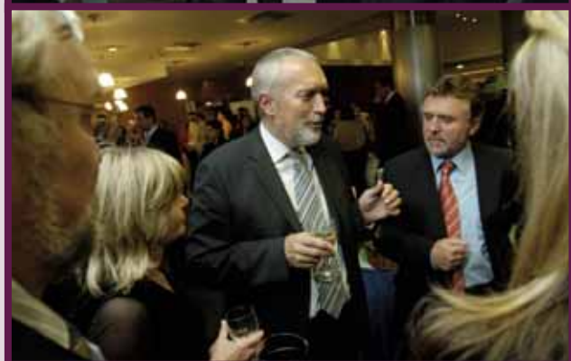
Večerní, společenská část sněmu pak byla plná družné zábavy...