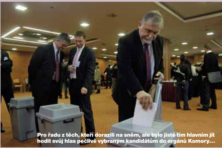
Pro řadu z těch, kteří dorazili na sněm, ale bylo jistě tím hlavním jít hodit svůj hlas pečlivě vybraným kandidátům do orgánů Komory...