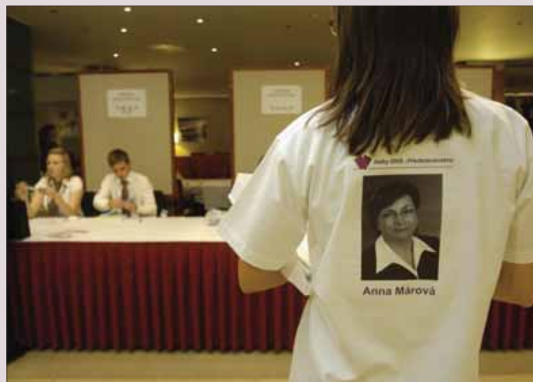
Volební kampaň „zuřila“ v předsálí do posledního okamžiku.