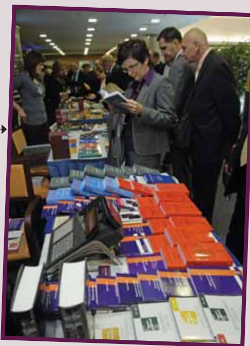
...nakoupit si výhodně odbornou literaturu u Becka, Lindeho nebo Aleše Čeňka...