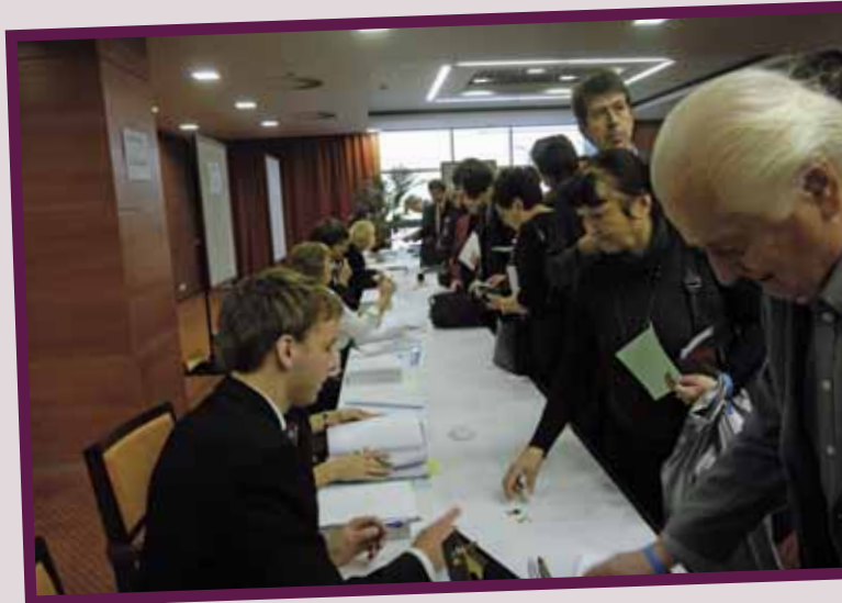
... později, když konečně dorazili zasněžení mimopražští, i stálým nedostatkem času štvani Pražáci, asi tak...