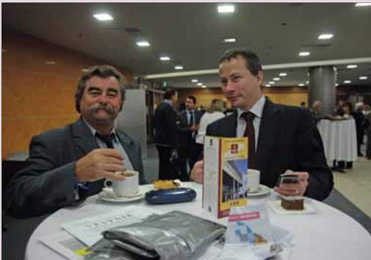
... ale skoro stejně důležité bylo potkat se se známými a přáteli...