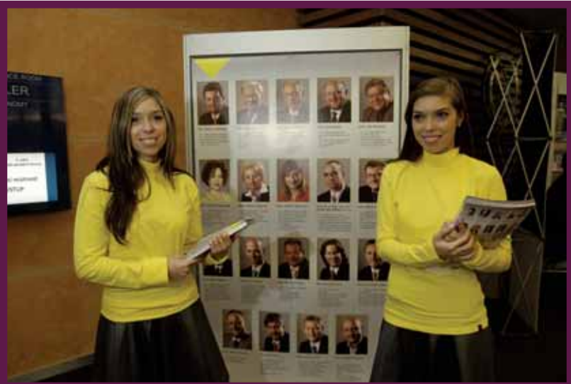
Historicky poprvé měli účastníci sněmu možnost se začíst do „sněmovních novin“, které pro ně připravil dlouhodobý partner Komory, společnost EPRAVO.CZ. Místo novinových kachen ale EPRAVO nabízelo s velkým ohlasem u svého stánku kachny pečené či marcipánové.