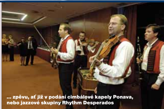
... zpěvu, ať již v podání cimbálové kapely Ponava, nebo jazzové skupiny Rhythm Desperados