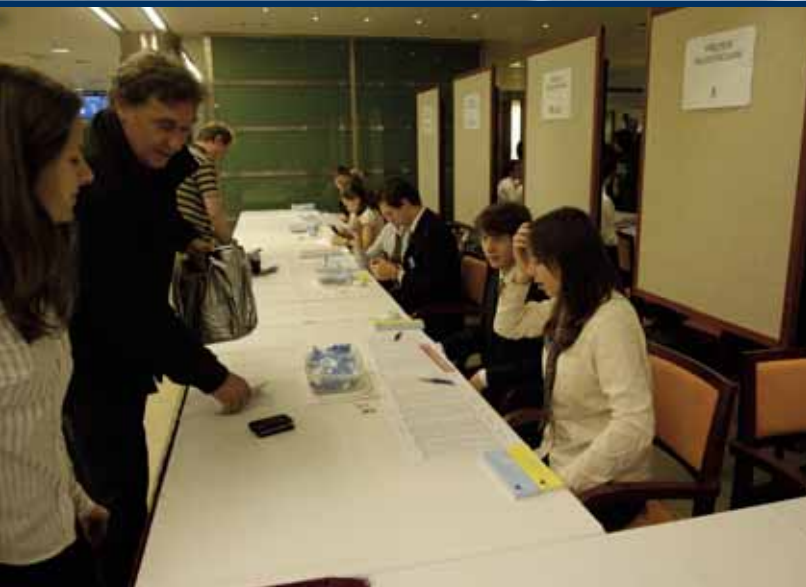
Nejdříve bylo samozřejmě nutné se na sněm zaregistrovat. Zpočátku to vypadalo tak...