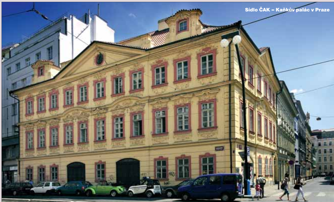
Sídlo ČAK – Kaňkův palác v Praze