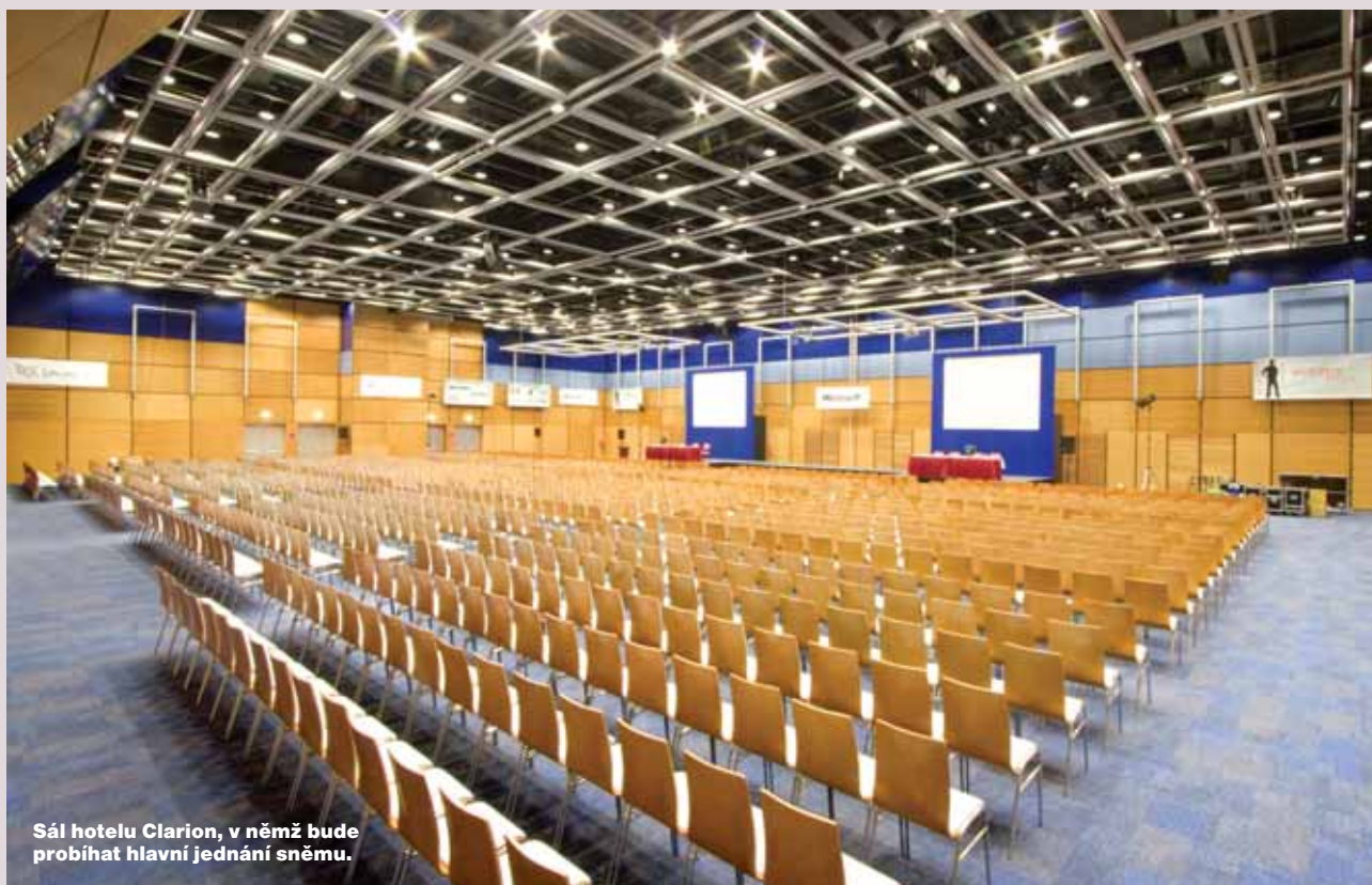
Sál hotelu Clarion, v němž bude probíhat hlavní jednání sněmu.