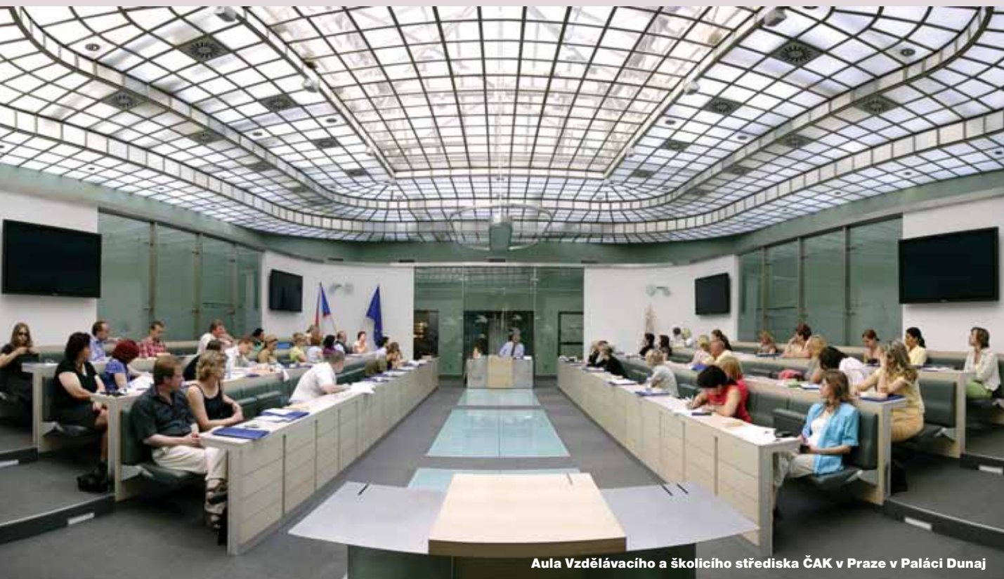
Aula Vzdělávacího a školicího střediska ČAK v Praze v Paláci Dunaj

Do oblasti vzdělávací samozřejmě náleží starost představenstva o věcnou i finanční dostupnost příslušné literatury, odborných publikací, aktuální judikatury apod.